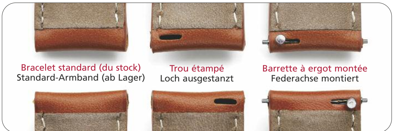
Bracelet standard (du stock) Standard-Armband (ab Lager)