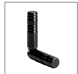
Modell 330.01, PVD schwarz Modèle 330.01, PVD noir